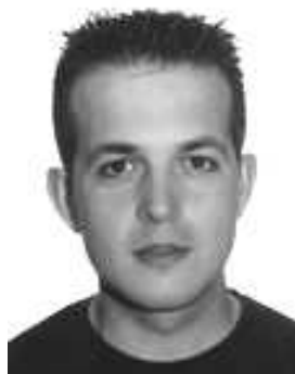
Por: Javi Catillo Técnico Informático Municipal

L as nuevas tecnologías cada vez están mas presentes en nuestro día a día. Internet, casi sin darnos cuenta, se ha convertido en un medio imprescindible en nuestras actividades más cotidianas. Nos movemos en una sociedad en que el acceso a la información es primordial. Necesitamos la información la instante, sin demoras, para ello desde el Ayuntamiento de Alcampell estamos trabajando en varios proyectos para mejorar el acceso a la información de nuestros vecinos.