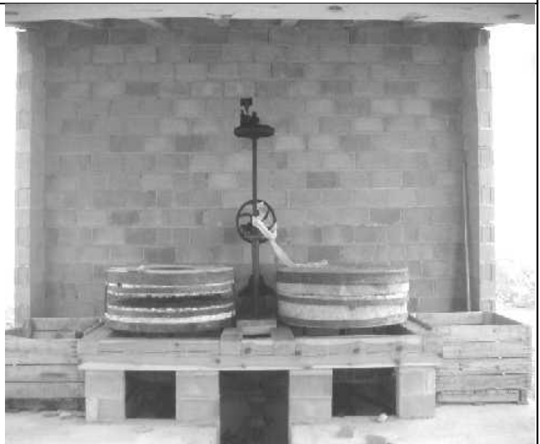
Pedres i maquinària del Molí de Falagué al solar del antic quartel