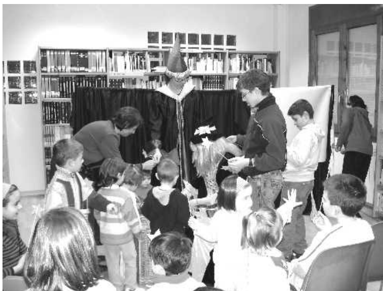
Actuación en la Biblioteca del Grupo Cultural El Globo el pasado 27 de Diciembre. “La magia y el miedo: Hadas, Brujas y Fantasmas”