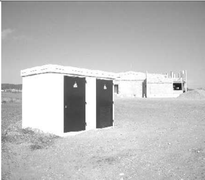
En primer pla transformador elèctric de la Zona Industrial Al fons es pot veure les noves instal·lacions de Chelats Sarrate.