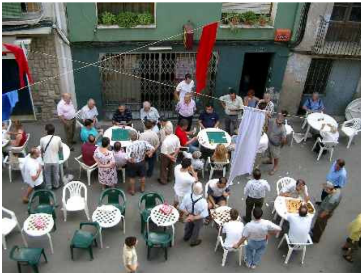
BUTIFARRA, ESCACS I PINTURA A LA PLAÇA