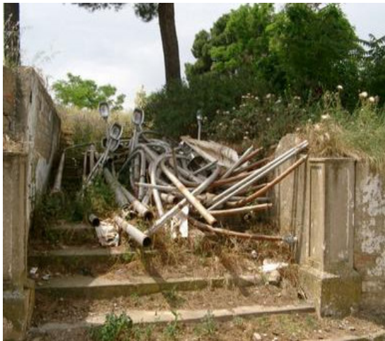
FAROLAS TIRADES A LES ESCALES DE L'ANTIC CUARTEL, ABANS DE LA NETEJA