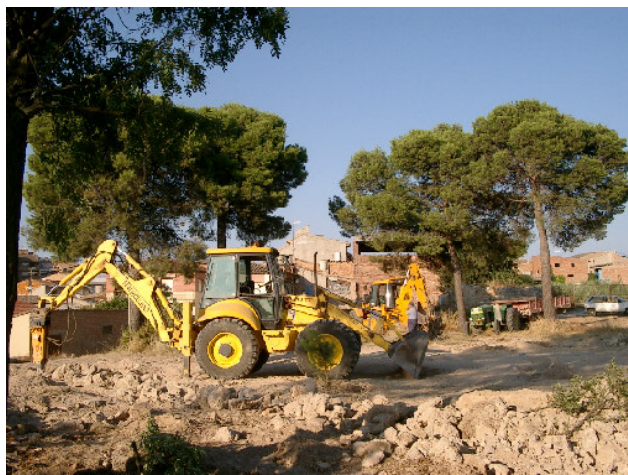
TREBALLS DE NETEJA I ACONDICIONAMENT

Aquest estiu, i davant del perill que suposava per la integritat dels veïns i els nens que podien accedir-hi degut a la gran quantitat de deixalles de tot tipus acumulades així com l'elevat risc d'incendi per la brossa, rames i herba seca que s'hi acumulava es va procedir a fer una important neteja.