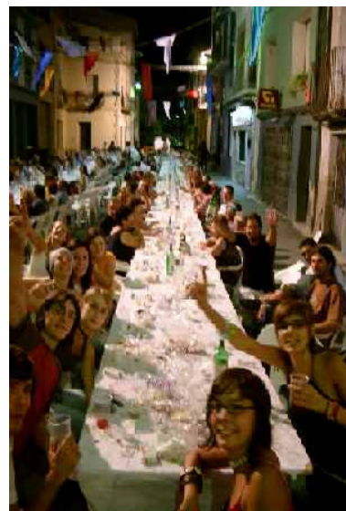
EL SOPAR POPULAR VA TENIR FORÇA ACEPTACIÓ

Així es poden resumir les festes d'aquest any. Es van realitzar variats actes per tots els públics; nens, joves, gent gran, etc. Molt centrats en la participació activa i l'entreteniment de veïns i visitants i moltes novetats i atraccions van contribuir a fer un bon ambient festiu. Es un bon indicatiu de per on te que continuar el camí.